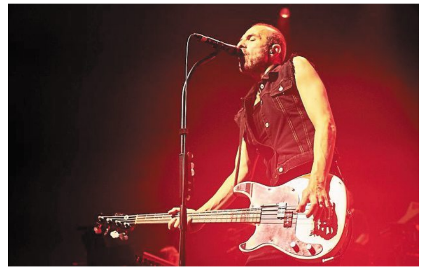
Calogero a entamé sa tournée en janvier. Il revient à Caen le 30 novembre.

Après un passage par la scène du Zénith le 31 janvier, Calogero foulera à nouveau la grande scène caennaise samedi 30 novembre, dans le cadre de sa fin de tournée. Il reste des places !