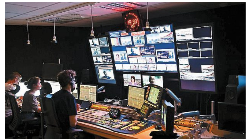
Le nouveau lieu dédié à l'audiovisuel, La Bananerie, situé boulevard Leroy, dispose d'un studio TV qui sera mis à disposition des visiteurs, lors des journées portes ouvertes, vendredi et samedi.

Lieu d'échange et de travail dédié à l'audiovisuel, le studio collaboratif La Bananerie vient de s'installer dans l'ancien hangar à bananes du boulevard Leroy, pour accueillir une nouvelle génération de créateurs et professionnels de l'audiovisuel.